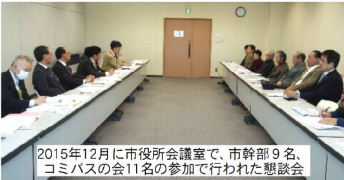
2015年12月に市役所会議室で、市幹部9名、コミバスの会11名の参加で行われた懇談会