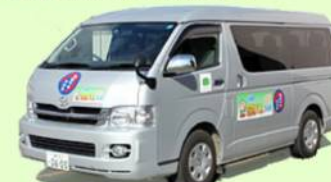
玉城町の元気バス 9人乗りワゴン車