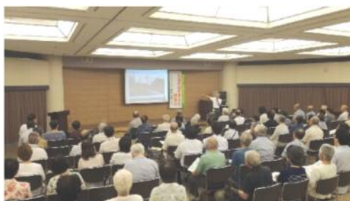
2018年8月、さつきプラザで「生活交 通を考えるシンポジウム」を開催。