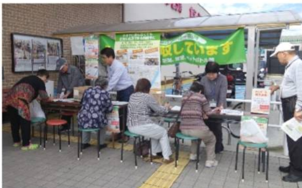
市内スーパー前や地域の集まりに出か けて、アンケート活動をすすめています。 その数は約5,000になります。