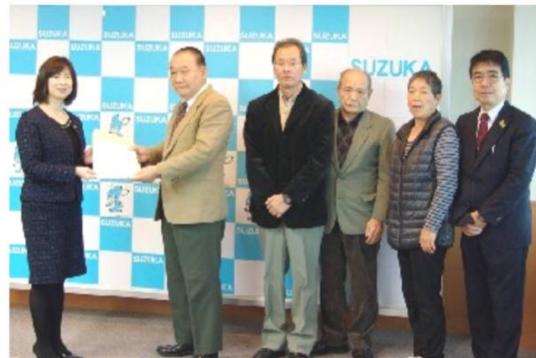
2017年12月、末松市長と会代表による懇談。会員の思い と具体的な提案を、直接、市長に届けた有意義な懇談でした。