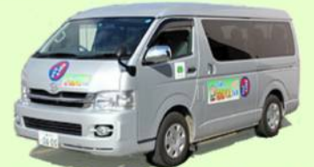
玉城町の元気バス 9人乗りワゴン車