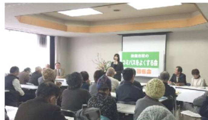
2018年2月、約70名の出席で第4回総会を開催。 末松則子市長にご挨拶をいただきました。