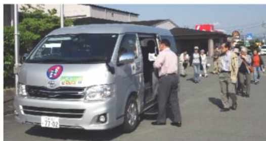
年1回、先進地の見学会。三重県玉城町 には2回行って学んできました。