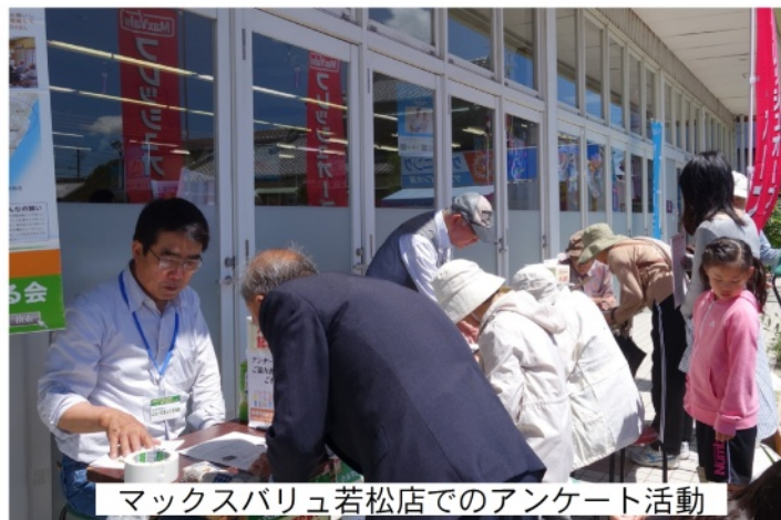
マックスバリュ若松店でのアンケート活動

午後2時半までに109名の方に記入して頂きました。ありがとうございました。来週の土曜日6月13日はマックスバリュ鈴鹿店(カーマ横)店頭で9時半~午後2時半まで行います。皆さんのご協力をお願いします。