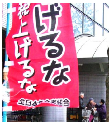
年金一斉宣伝

2ヶ月に一度の年金支給日に、ハンター前で、署名活動、チラシ配り、マイクで訴えを行っています。