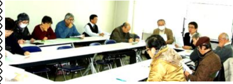
コミバスの会総会

する会」第3回総会が鈴鹿市社会福祉センターで催されました。出席者16名で活動の報告やこれからの方針など色々話し合いました。