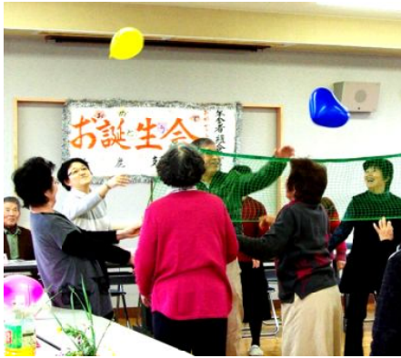
風船パレーを楽しむ

んからの意見を無視し、平均17%の値上げ案を変更せず出してきました。この協議会後、鈴鹿社保協は市長との懇談を申し入れました。市長とは会えませんでした。国民保険年金課の部長・課長との懇談を行いました。協議会ですされた市民の声をなぜ聞けないのか迫りましたが、市側は受け付けませんでした。そして3月議会に国保平均17%値上げ案が出されました。