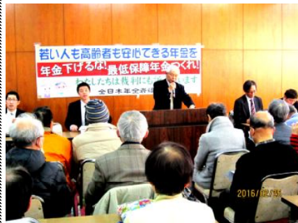
報告集会