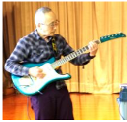
ベンチャーズモデル