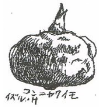
イラスト 樋口 出