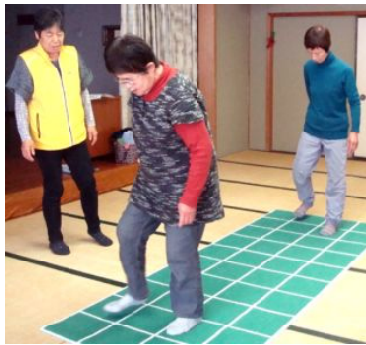
スクエアステップ

二月十日（水）十時〜十二時 社会福祉会館二階大広間。今年初めてのスクエアステップが開かれました。参加者は、十名でした。