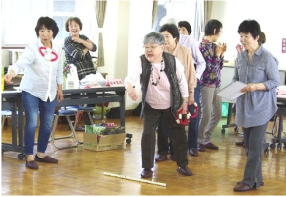
誕生会輪投げで楽しむ

午後一息ついた時間帯にみる「水戸黄門」の主題歌には、いい意味が詠まれていることを教えていただきました。