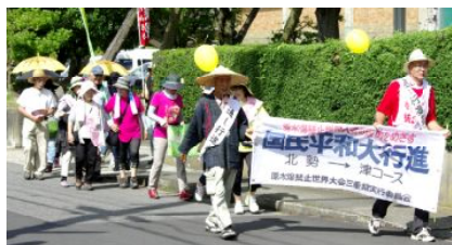
2日目の行進風景

園から市役所までと、江島の体育館から鼓ヶ浦公民館まで歩きました。年金者組合、医療生協、建労など各団体から多くの参加があり、若い人も多く元気をもらい頑張って歩きました。