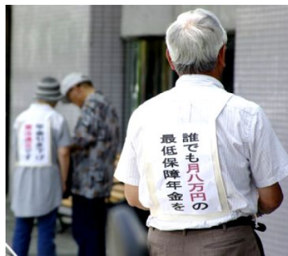
新調のゼッケン