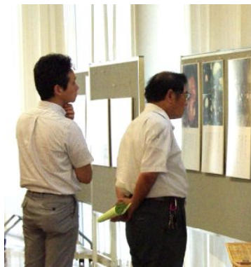
会場風景