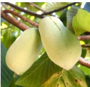
幻の果物「ポポー」

翌日17日、わたしは畑のポポーの木に、ありがと、美味しくかったことを伝えて、来年もよろしくと頼みました。