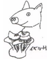
イラスト 樋口 出