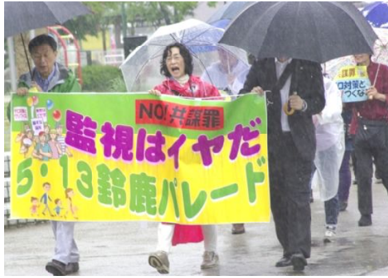
雨中のパレード