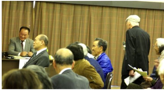
大成功だったシンポ

4月24日、名古屋地方裁判所で開かれた年金訴訟の第6回公判を傍聴しました。地裁前には大勢の支援者が