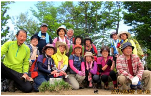
頂上での記念撮影

一回目の観音山〜堀坂山ではお目当てのヒカゲツツジの花は残念ながら散ってしまっただけで代わりに山腹に広がるヤマツツジの花が迎えてくれました。