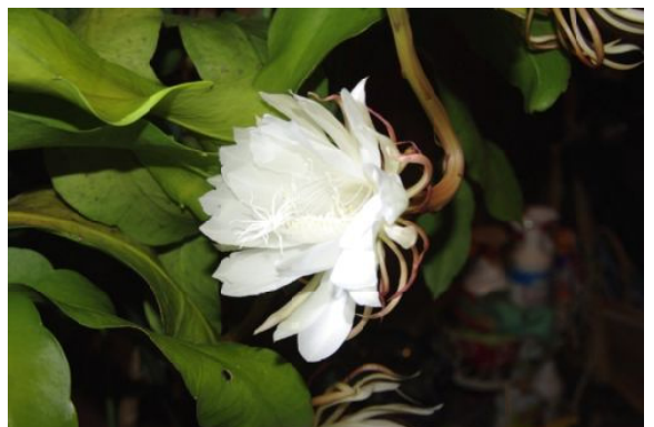
月下美人