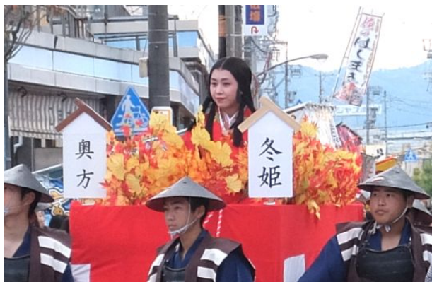
氏郷まつり

おまつりのメイン、武者行列には氏郷ゆかりの地、滋賀や岐阜をはじめ、各地から華麗な衣装をまとった応援団も駆けつけ、沿道からは大きな拍手がおくられました。武者