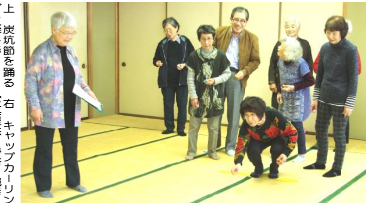
上 炭坑節を踊る 右 キャップカーリン グを楽しむ