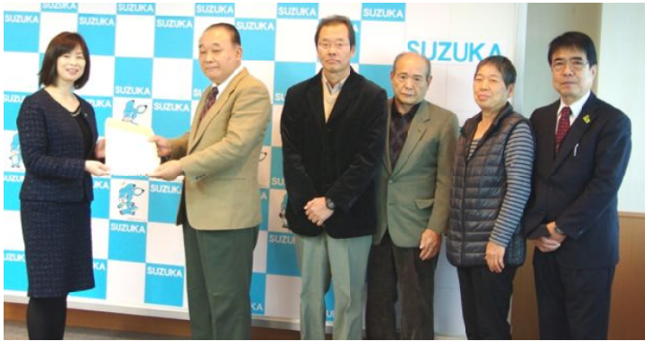
コミバスの会の実施プランを市長に手渡す