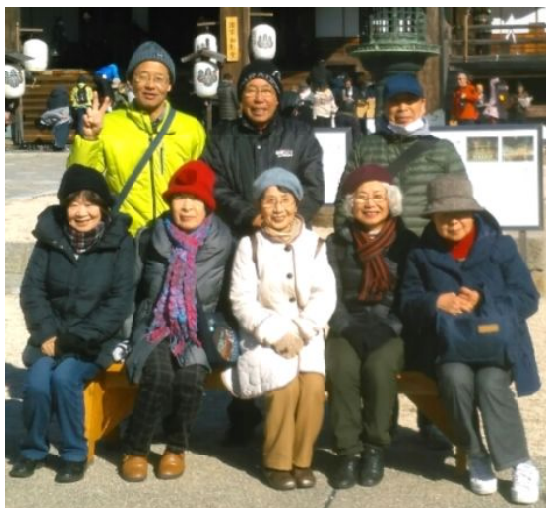
史跡めぐりの会 専修寺本堂前

昨年、国宝に指定された如来堂と御影堂は県内建築物としては初めてのことで。私たちも神妙に手を合わせ今年は無事を祈りました。とろろ定食でおなかを満たした後、参道の露店を見物し