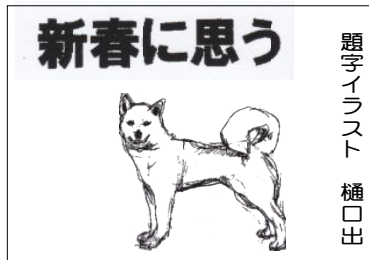
題字イラスト 樋口出

日本国憲法が公布された年に生まれた私は憲法に守られて生きてきました。家族が兵隊になることも、住んでいる地域が戦場になることもない。生活に困れば自治体が助けてくれる。勉強したければ女だからと遠慮しなくても