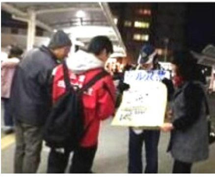
シール投票

で目標の215名になります。近所づきあいでよく知っている人、ボランティア活動や趣味でのお友達等、ひき続き声をかけていただいで目標を達成できるよう、皆さんのご協力をお願いします。