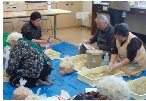
みその仕込み

「神戸の寝釈迦」初日の土曜日でしたので、混雑が予想され心配しましたが、ジェフリーの配慮で順調に終えることが出来ました。