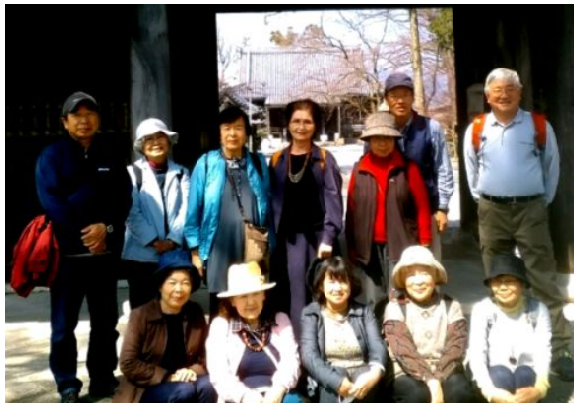
向源寺前にて