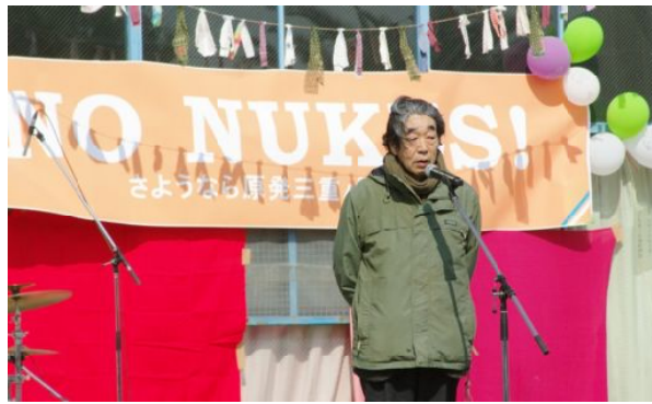
講演する秋山豊寛さん