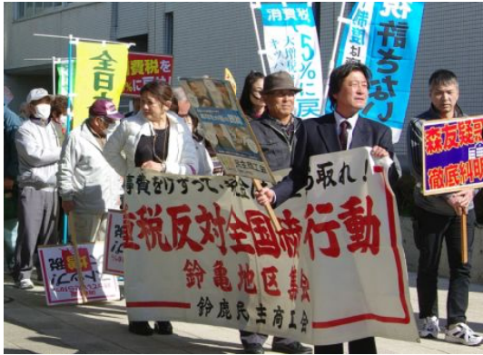
重税反対行動パレード

表題の集会・パレードが、鈴鹿民商と鈴鹿年金者組合の共催で、3月12日に行われました。