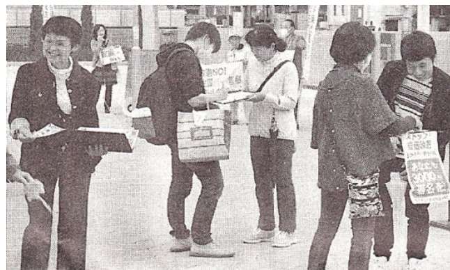
活動する参加者

る鈴鹿市民の会」は、4月6日、白子駅西で、22人が参加し、シール投票や「3000万人署名」に取り組みました。40分間で30人分の署名が集まりました。