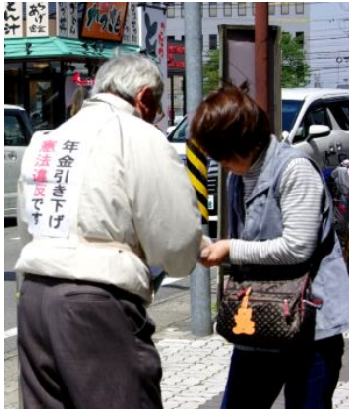
署名活動