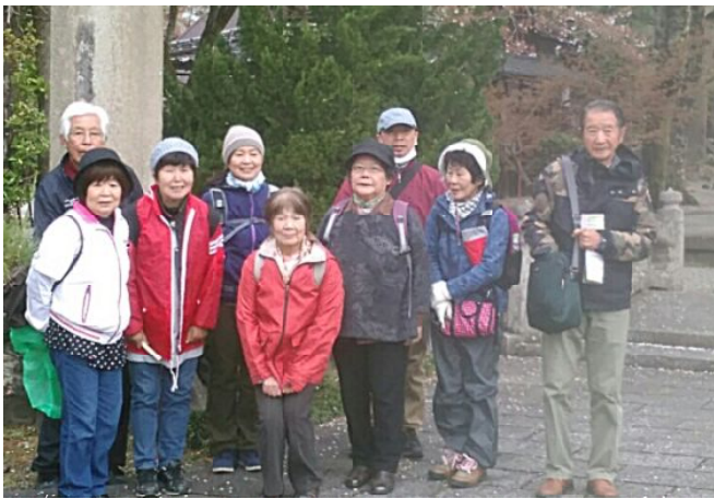
向源寺門前にて