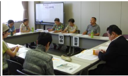
介護分科会