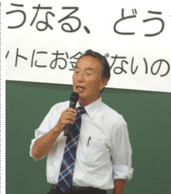
講演