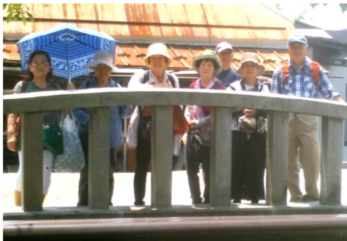
地蔵川の橋にて

うだるような暑いさなかの7月17日(火) 8名の参加で滋賀県米原市の醒ヶ井を訪ねました。聞きなれない地名は神話が由来とされ、江戸時代は旧中山道の宿場町でした。一行は伊勢鉄道鈴鹿駅から名古屋経由でJR醒ヶ井駅へ。やっぱり暑い！駅前から数分も歩くときれいに保存された旧中山道の町並みが現れます。