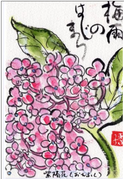
絵手紙 提供 藤本 明子