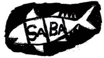
イラスト 樋口 出

作り方 ①キャベツ、トマトは、一口大に切り、鍋に、鯖缶と一緒にに入れて、コトコト弱火~中火で煮込む。 ②お好みで、塩少々、又は、ダシ、しょうゆ少々、又は、オリーブオイル少々を加えて、味を調える。 ※冷めてもおいしい。知人に聞いたレシピです。一度作ってはいかががでしょうか。