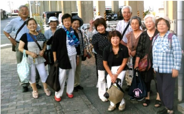
記念写真

大須観音にお参りした後、昼食を食べたり商店街を散策して開演を待ちました。大須演芸場はそれほど広くありませんが、クーラーの効いたホールには大勢の方が来演していました。