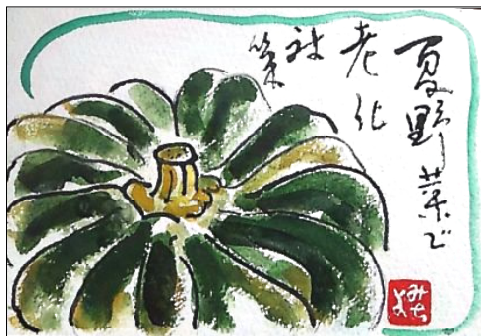
絵手紙 提供 長岡 美千代

「ご存知ですか?申請すれば高い介護用具のレンタル料が、 全労連共済加入者 は、無料になることを。」