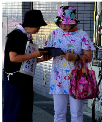
署名活動