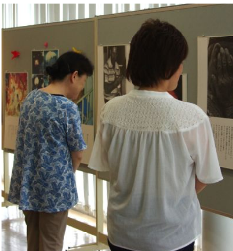
写真に見入る

それには九条改憲を絶対に阻止しなければならない。それが日本の国民に課せられた課題ではないでしょうか。