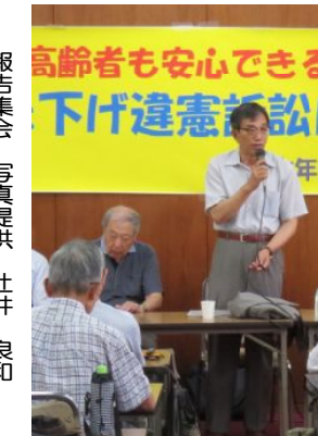
報告集会

自己紹介は苦手だが、人の話は楽しいもの。昼食はチラシ弁当、その他手作りの焼き林檎に、とうふ、ゼリー、他にもまだまだあり、おいしくて、つい手ができました。ゲームのキャップカーリングでは思いもなかった1等賞をいただきました。商品にいろいろなものが入っていました。割りばし、ポケットティッシュ、他生活用品でした。楽しい時間を過ごさせてもらいました。ありがとうございました。