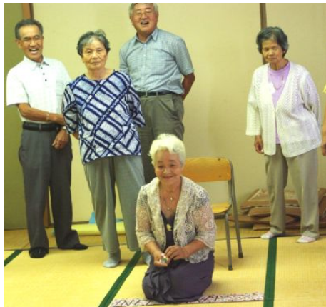
キャップカーリング