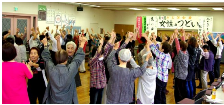
大笑いの笑いヨガ

ひびこほしちきくくらない、平和で安心して暮らせるように、女性の年金低すぎる、他の支部の仲間とも語り合いたい、そんな思いで始めたみえ年金者「女性のつどい」も今年で3回目を迎え、9月21日(金)ジェフリーすずかで、県内の北は員弁、南は牟婁まで6支部、総勢90名近くが一堂に会し、交流を楽しみました。