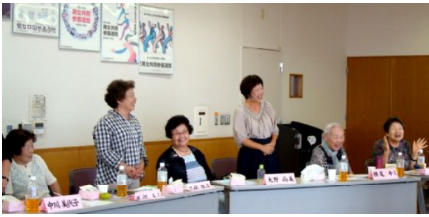
楽しい百の会

お昼は「味ご飯」のお弁当でした。そして、女性部の手作りのサラダ・お吸い物、抹茶のふるまいなどもあり、心暖まるおもてなしでした。