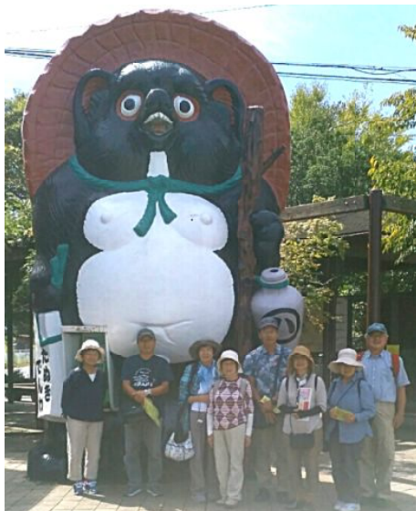
大狸の前で

木立の間を縫うように線路が続く「高原鉄道」の名前に恥じない美しい風景が続いていました。途中の駅には、かつて奈良時代に離宮が置かれていたことを思わせる「勅旨」