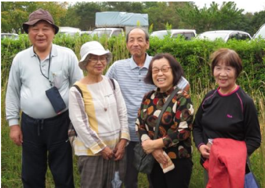
ウォーキング

とてもおいしくてお代わりをしました。大人の味で多くの人と一緒に食べるのは格別でした。 午後は軽スポーツと歌とおしゃべり。私はグラウンドゴルフに参加しました。あっという間に時間が過ぎていきました。最後は宝探し。少し雨が降り出しましたが、小雨だったので無事閉会式まで行いました。 カレーとサラダを用意してくださいました皆さん本当に疲れ様でした。とても楽しい1日がありました。