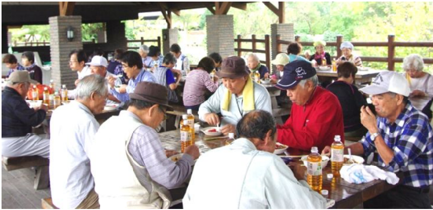
昼食風景

10月10日、健康フェスタ、40人を超える参加がありました。申込用紙に書いて出してもらった人が少なく、最初は不安でした。10日が近づくと多くの人に声をかけてもらい、当日は40人を越える参加者となりました。 お昼はカレーと野菜サラダ。