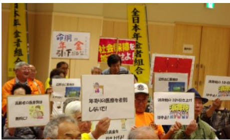
プラカードを高く掲げて

その後、会場から松菱前折り返し、お城西公園前までパレードしました。鈴鹿支部は、4本のプラカードと1本の幟、桑原支部長のハンドマイクシユプレヒコールで行進しました。