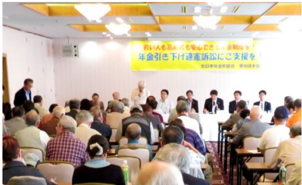
百人を超える報告集会