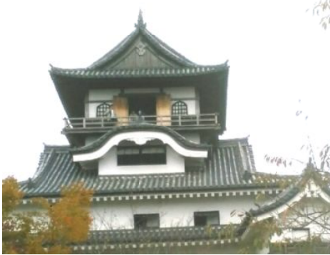
国宝犬山城

10月23日(火) 14名参加。全国で国宝に指定されている五つのお城のうちの一つ、愛知県、犬山城を訪ねました。ちょっと空模様が心配でしたが、さわやかな空気につつまれながら深まりゆく秋の一日を満喫しました。