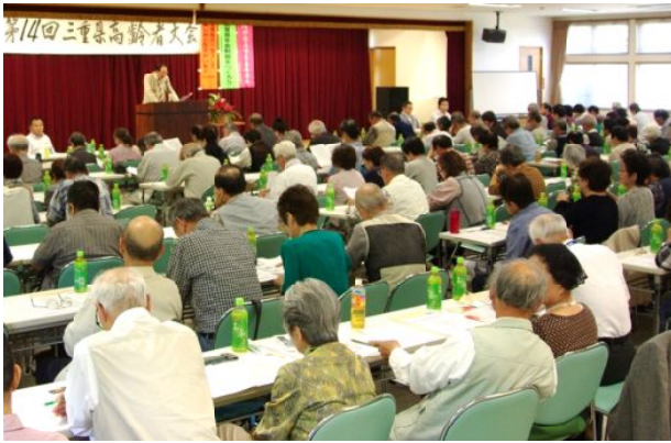
右 実行委員長挨拶の全体会場 左 鈴鹿支部女性部活動報告