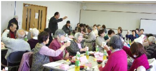
誕生会 乾杯

その日の夕方、辺りが薄暗くなる中、一人で散歩に出かけた兄が帰ってきました。心配した弟は「探しに行った方が良いと思うが、17時を過ぎたので、僕一人では外へ出られない。学校で17時を過ぎたら大人と行動するように言われている」と言う。見かねた娘(おば)が懐中電灯を手に一緒に探しに出かけようと玄関を出た瞬間、兄が駆け足で帰ってきました。「久しぶりに海を見たくなったが思いの外遠かった」と。弟は「心配したんだからもう」と膨れっ面。心がほんわかしたひとときでした。