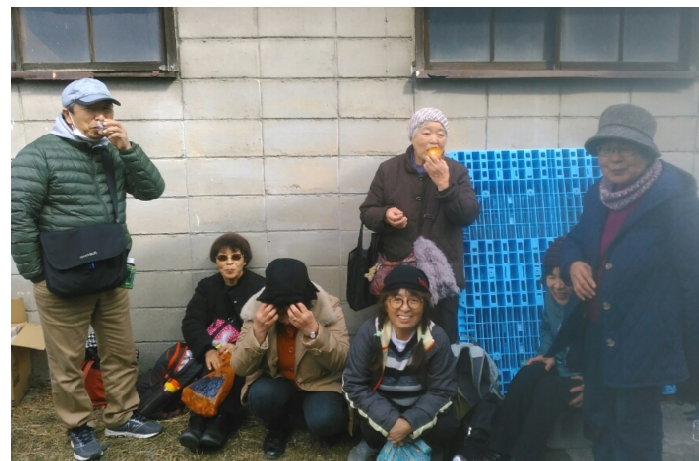
史跡めぐりの会 酒蔵めぐり