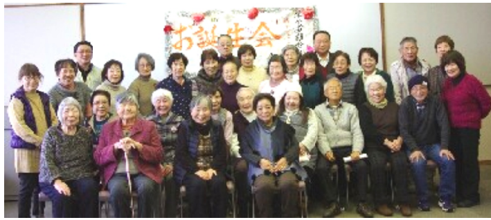
記念写真

く元気でいなければ……と、美容の話、料理の話に花が咲き、料理などいろいろ教わって、勉強にもなり、ありがとうございました。