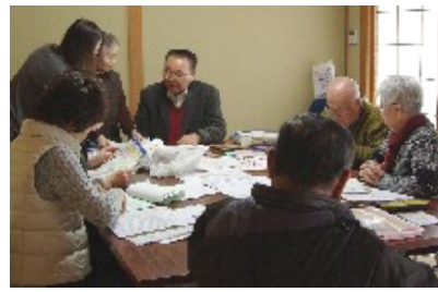
申告相談会

士さんを講師に迎え、約2時間の学習会を開きました。まず、税制度の成り立ちは、終戦後のアメリカ力占領