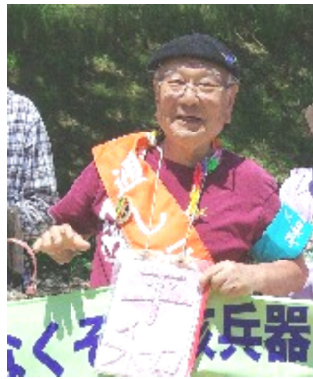
山口さん

8月6日、9日に広島、長崎で「原水爆禁止世界大会」が行われます。今、日本の各地から広島、長崎に向けて平和行進が行われています。鈴鹿市でも高岡公園から津市へ向けて6月13、14日の2日間平和行進が行われ、年金者組合員も参加しました。 今年は和歌山から広島まで