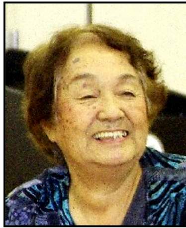
2016年9月 百の会

鈴鹿支部23年間、女性部17年間の活動を中心に、世のため、人のために、行動され、人間味あふれる方でした。本当に頭が下がります。また、年金者組合とは、女性部とは、・・・についても、どうあるべきか等をしつかり伝授して頂きました。これまでに、何度かお叱りの言葉も頂きました。今となっては、どれもよい思い出です。