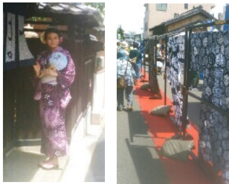
有松しぼりまつり「ゆかた」2葉

展や山鉾のからくりを見せるイベントもあり、また、地元出身のシンガーソングライターの歌も聞けて、とても暑い一日でしたが、楽しませていただきました。