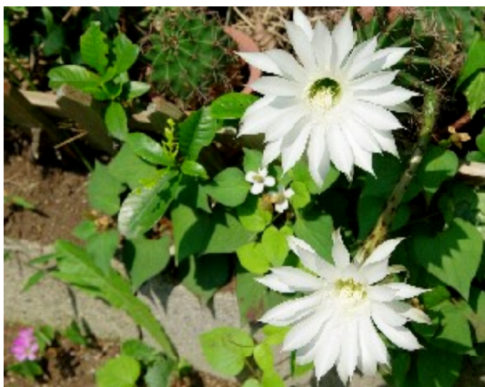
久し振りに咲きました。さぼてん