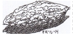
イラスト 樋口 出

作り方 ゴーヤは半分に切って、中の綿を取る。薄くスライスする。フライパンにオリーブ油を引いて、ゴーヤを入れて炒める。シーチキンを入れ、水を少々入れて煮る。コンソメを入れて味をみる。お好みで、溶き卵を入れてとじてもいい。皿に盛りつける。