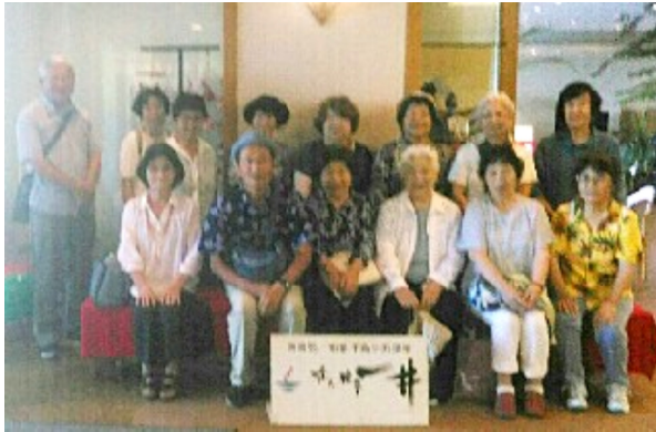
記念撮影

カーブの多い山道を30分くらい走り、「ホテル浜の雅」に到着。初めての相差、目の前に鳥羽湾が一望、静かな雰囲気のホテル。玄関を出れば、5分近くに海が広がる絶景。海では、家族連れが海水浴を楽しんでいた。