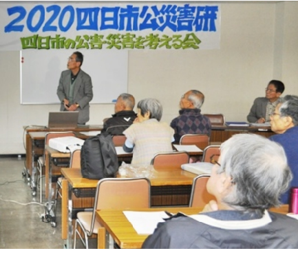
四日市公災害研

1月11日(土) 四日市文化会館で四日市の公災害を考える会主催で、元名大助教として日永の自主防災の会長をしてみえる松岡武夫さんのお話がありました。研究者であ