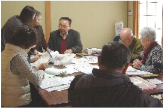
今年の申告相談