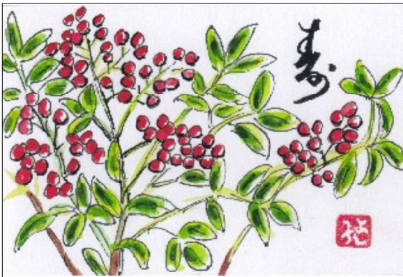
絵手紙 提供 宮崎 ヨシ

出来るだけ人の迷惑を掛けないようにと、思っているが、一ヶ月に一度の病院すら一人で行けない。誰もがいつかは迎える高齢期を安心して暮らせる社会に。今の安倍政権のやり方は、老いへの不安や恐れを増すことばかり、自分らしく生きがいを持って人生を楽しめたいいななど、目標なしに生きていこうと思っています。結婚して五十五年になりました。私は三人の子供に恵まれ、長男夫婦と住んでいます。孫七人曾孫三人、今では四世代の一族二十一人の大家族、正月には全員集まり、賑やかで料理も色とりどり、孫達も育ち盛りでよく食べる。大勢の中で、曾孫はびっくり、でも喜んで二