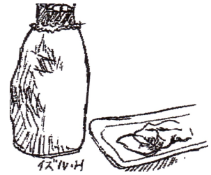
イラスト 樋口 出

作り方 大根は皮をむき、5~6cm大の乱切りにする。 鶏肉は3~4cmの角切り、酒小さじ1、酒少々を振りなじませる。 深めのフライパンにごま油を温め、鶏肉を入れて、中火で焼き色を付ける。 大根、ニンニクを加えて、さっと炒め、水、酒、しょうゆ大さじ1、トウバンジャンを加える。煮立ったら落としぶたをし、ふたをずらして中火で約20分煮汁が少なくなるまで煮る。