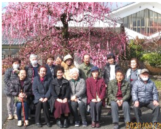
温泉めぐる会 月ヶ瀬

参加者はコロナウイルスを警戒して欠席もあり16人の参加でした。マイクロバスに乗る前に、バスの手すりも椅子もあらかじめアルコールで拭いておきました。アルコールで手を消毒して、全員マスクを着用して頂き、話しをするときもマスクのままでお願