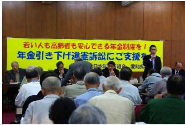
閉廷後の桜華会館での報告集会

今全国で一斉に年金裁判が行われているが、これはまさに署名用紙を出し、二人三脚でお願いしました。ほとんどの方が「これ以上年金が下がったら生活できないものね」と、快く書いて下さり、思わず力が入り、会話もしと、意外と楽しく出来たかなと大成功！何でもやってみるもんだなあ」と、自画自賛。そして、「年金者組合ですが」という言葉も大切ですね。組合の名前が後押ししてくれたようです。