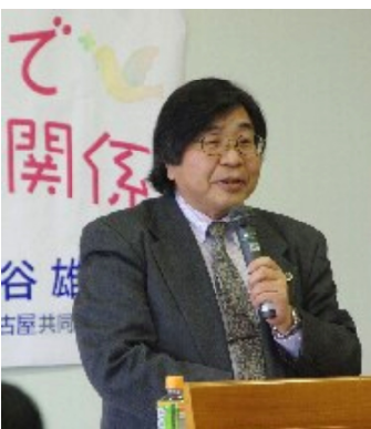
中谷弁護士

最後に、歴史認識と日韓和解の道は、条理に基づく冷静な議論と、外交上の経路を通じての協議、植民地主義の負の遺産を清算することの追求です、と強調されました。