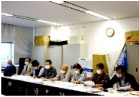
話し合う労連の皆さん