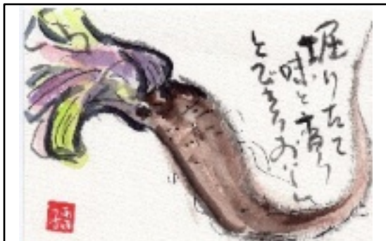
絵手紙 提供 藤本 明子

3度目にはモロヘイヤもプラスしました。長芋、オクラ等のねばりは、身体にいい食品だと思います。