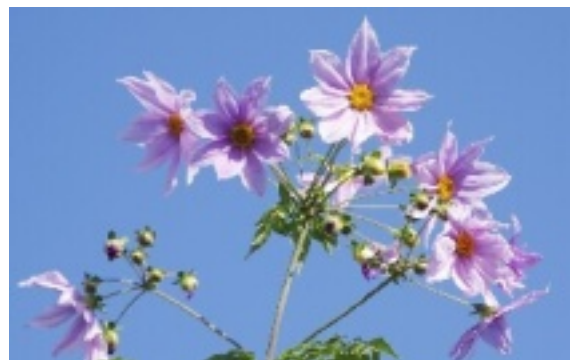
我が家の皇帝ダリア

暇だと酒を飲んで過ごしてしまうから仕事をやっていた方がよいそうです。家族は12年前に息子さんを事故で亡くし、奥さんと息子さんのお嫁さん、お孫さん（中学生の男の子）の4人の家族とフレンチブルドッグ一匹でマンション暮らしだそうです。「マンションで犬を飼ってもいいんですか？」と聞いて