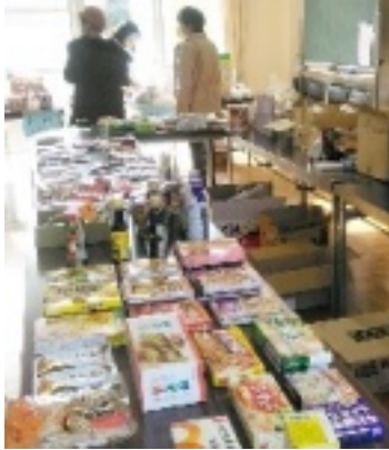
フードパントリー

新型コロナウィルスの影響で生活が困窮している人を支援したいという思いで立ち上げたプロジェクトで、地域で余った食料の提供やカンパを