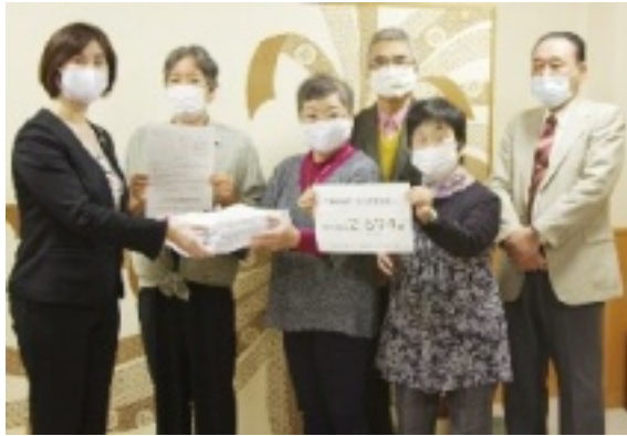
署名を市長に提出