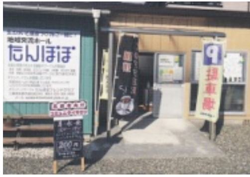
稲生サロン