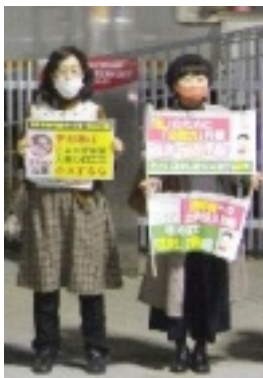
高橋・山本さん

学術会議が政府の都合のよい組織への転換の危険性がある。研究費分配が、政府の都合のよい見解を発信する教授への割り当てが増える。それは研究内容の実質的な統制・弾圧(禁止)につながる。政府批判への抑制、それは結局、政治の独裁化だ。