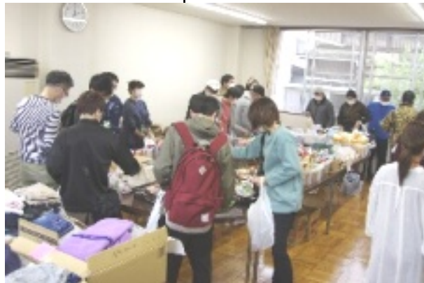
パントリー4. 4