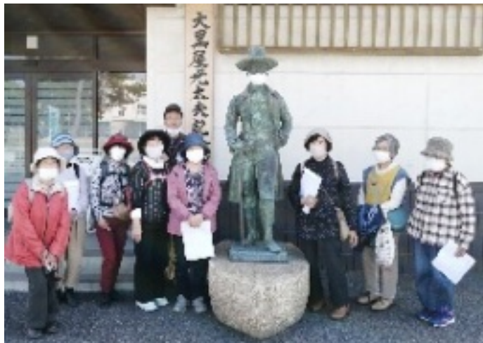
光太夫像と一緒に

寺（だるま寺）のサツキを見物 集合…ジエフリー時集合10時7分 発Cバスを利用。