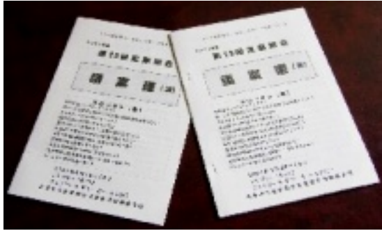
2021総会議案書