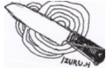
イラスト 樋口 出

材料 (2人分) 新玉ねぎ2個 豚ミンチ50g 油 大さじ1 A(だし汁1/2カップ 薄口しょうゆ みりん各大さじ1と1/2) 木の芽適量