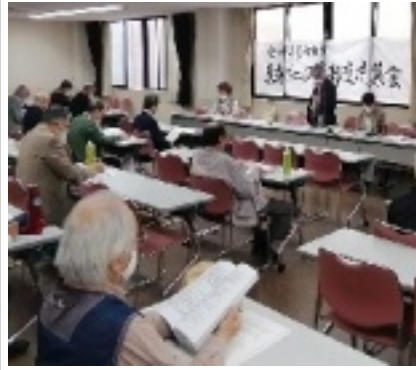
全体集会