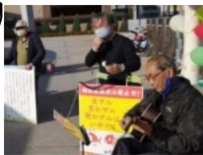
橋詰圭一 写真提供 生コーラス

コロナ感染広がりの中、人を心配しましたが、近くの体育館で高校の県大会があり、多くの高校生が関心の高い