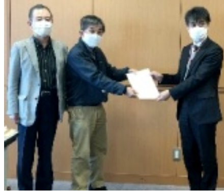
質問書を手渡す

この日手渡した質問については、国の方針より一歩進んで、訪問介護・ケアマネージャーについても、順次接種に取り組みたいと回答しました。北勢他市より進んでいると評価しました。しかし、PCR検査については、相変わらず国の方針通り回答。病院や介護事業所、