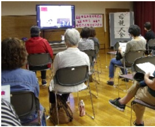
鈴鹿会場