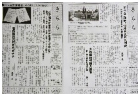
「入賞」した右3月号 左4月号の各1面

「窓口医療費2倍化するな」「健康で長生きしよう」「コロナに負けるな」「政権交替」