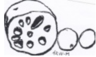
イラスト 樋口 出

作り方 A ①れんこんは皮をむいて、1cmの輪切りにして水にさらした後、酢を少々入れた鍋でゆでる。 ②れんこんを花形に切り、水にさらす。 ③煮汁の材料を煮立て、水気を切った②を入れ、30分位煮て、みりん1/4カップを加えて煮上げる。 B ①れんこんは、Aと同様に下ごしらえして、煮汁で煮て、みりん大3を加えて煮上げる。