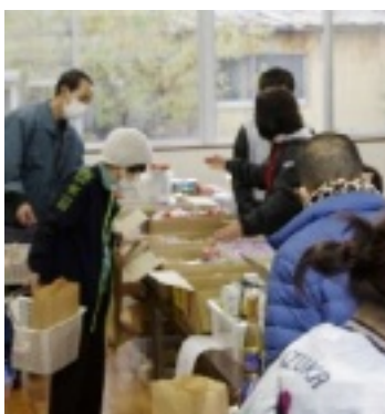
会場風景