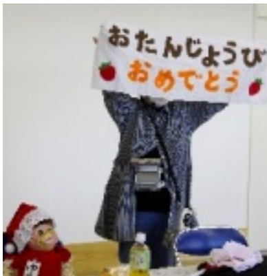
ゆりかちゃんのお祝い