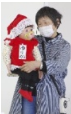
ゆりかちゃん

全日本年金者組合 三重県鈴鹿支部 第297号 2021. 12. 26 事務局 〒513-1124 鈴鹿市自由ヶ丘 1-16-30 http://suzuka-nenkinsya.jimda.com/ 桑原 篤 tel 059-374-2894 編集責任者 勝谷鐵幸 鈴鹿市平岡町641-20 tel 059-387-0383 fax 059-387-0383 e-mail c9awvah@sf.comufa.jp