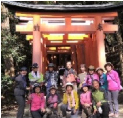
記念写真

4月5日(火) 快晴(第一回目)、参加者 13名 JR関駅7時10分発、〇ーカル線(関西線)に乗り京都に、京都一周トレイル第1回目。JR桃山駅からスタート。民家の庭の桜、公園の桜がすべて満開、桜の歓迎を受けて快調に歩くことができました。途中、伏見桃山城で休憩。満開の桜とお城は絶景、これだけで大満足、差し入れの「赤福餅」は最高。 さらに桜の中を進み、大岩展望台で昼食、眼下に京都市内を眺め、周りの桜に囲まれて美味しい食事を楽しみました。右も左も桜、足も軽くなる気分です。赤い鳥居の中を歩き、