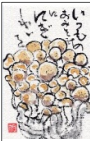
絵手紙 提供 藤本 明子

5月12日(木) 執委後 女性部世話役会 ジェフリーすずか 5月24日(火) 13時~ 女性部総会 ジェフリーすずか