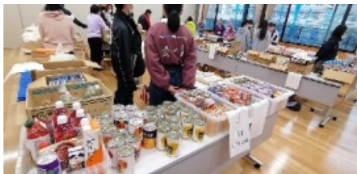
会場風景

コロナ禍で日々の暮らしに困窮している人々、辛い思いをしている人々に少しでもお役に立てたらと始めたフードパントリーも、1年半経って11回を数えましたが、ここで暫くお休みします。今までのご協力に感謝申し上げます。ありがたいございました。また、再開の節はよろしくお願いたします。