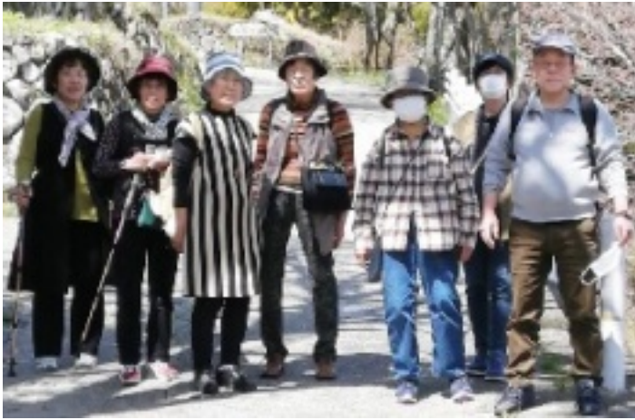
記念撮影