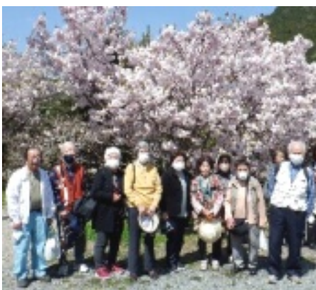
横輪桜をバックに記念写真