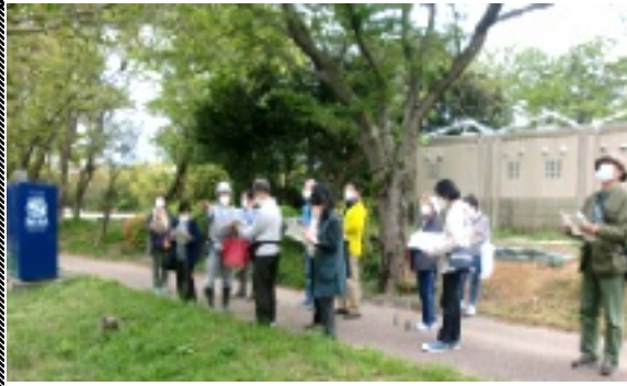
森の観察会

4月17日(日) 青少年センターで「森の報告集会」が行われ、30名が参加しました。