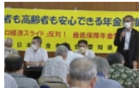
開廷後報告集会

控訴審があり、結審しました。来春2月22日14時30分より判決が言い渡されます。