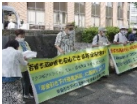
開廷前集会