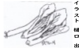
イラスト 樋口 出

※直ぐにでも食べられるが、保存容器に入れて冷蔵庫で一晩置くと白ネギがしんなりして美味しい。冷蔵庫で3日位保存できる。冷ややっこや納豆に和えても美味しい。