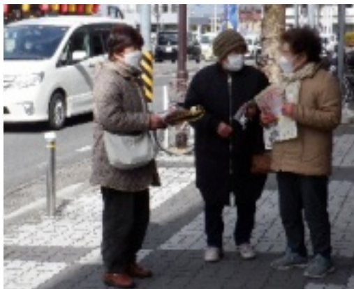
会話が弾む