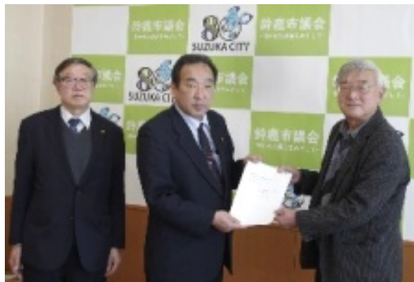
支部長から議長に手渡す

が組合員の約4割に達する実態と、補聴器使用者が少数である事態を踏まえ、市議会へ「加齢性難聴者の補聴器購入に対する市独自の公的補助制度の創設を求める請願書」を提出しました。政府が2015年に策定した「新オレンジプラン」で認知症を引き起こす危険因子として、加齢や高血圧のほか、難聴を上げていること、日本の補聴器購入の公的補助制度が低く、補聴器価格が高い、保険適用がない、それ故、補聴器の普及は極めて低いこと