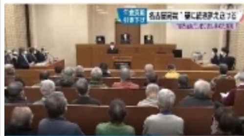
上 開廷前傍聴者などデモ行進して、公判 廷内へ向かう組合員等 下 開廷前の 写真提供 橋詰圭一 (NHKのニュース画 面)