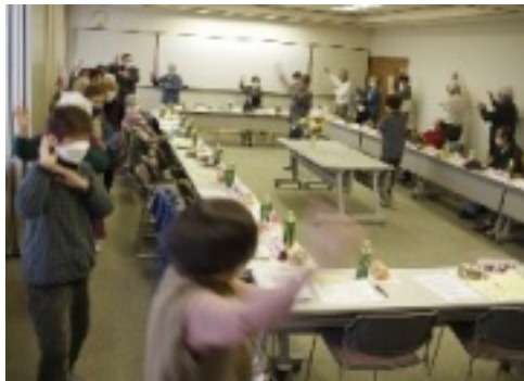
恒例の踊り

3月23日、私は一月、主人は三月で、二人一緒に誕生会に出席しました。二人一緒に参加でき、元気で嬉しいです。手遊び、替え歌、動物の鳴き声、早口言葉等苦笑い一杯でした。