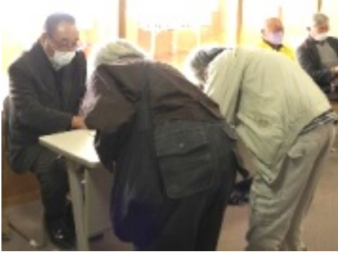
請願署名中

支部・亀山支部と民主商工会 鈴鹿支部共催の「重税反対全国統一行動鈴鹿地区行動」が行われました。