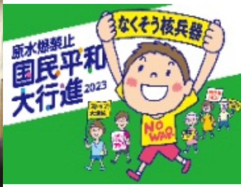
平和行進ポスター 写真原水協ホームページ

14日は朝8時30分 江島体育館東側集合・8時40分出發です。白子公民館(9時20分着の予定)まで、約2km行進します。公民館で30分休憩して鼓ヶ浦公民館へ向かいます。鈴鹿の行進はここまでです。津まで行く方は河芸まで車で移動となります。疲れ方を乗せる車を準備する予定です。二日のうち、どこからでも、一歩でも二歩でも参加してください。詳しいことは、「きらら」折り込みのチラシをご覧ください。