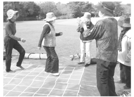
スクエアステップ