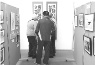
作品展示に見入る

て欲しいなどの意見もいただきました。皆さん真剣に見られたことが良く伝わってきました。オカリナ演奏では、良く知っている曲が多く、楽しく口ずさみながら聴いていた