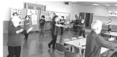
食後の軽運動・盆踊りなど。

全日本年金者組合 三重県鈴鹿支部 第320号 2023.11.12 事務局 〒513-1124 鈴鹿市自由ヶ丘 1-16-30 桑原 篤 tel 374-2894 編集責任 橋詰 圭一 鈴鹿市岸岡町2866-4 Tel.090-6577-3617 Fax 386-8561 メール k_hasizume_11@yahoo.co.jp