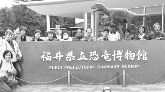
福井県立恐竜博物館 FUKUI PREFECTURAL DINOSAUR MUSEUM

明している姿もありました。恐竜の全身骨格が50体展示されているそうで私は全部本物ではないと思っていました。たがそのうちの10体は実物の化石を使ったものだそうです。知らないことばかりでもっと勉強して来ればよかったです。反省しています。