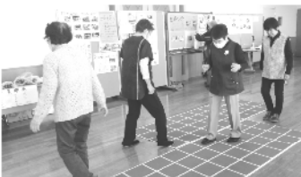
スクエアステップ