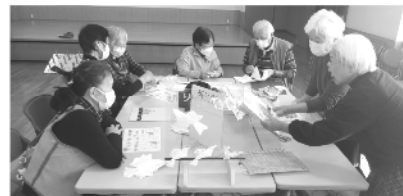
折り紙教室も盛況です。