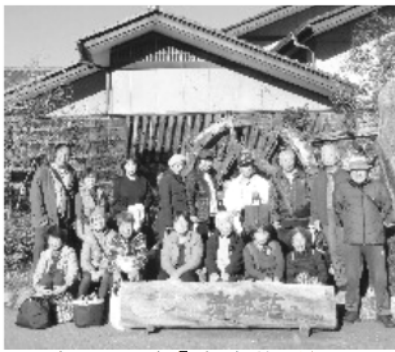
松川温泉「清流苑」前で

農協の直売所でリンゴなどを買いましたが、箱詰めは早くも売り切れており、各農家から売り出しているばら売りのりんごを買って箱に詰めて買いました。帰ってすぐ食べてみましたが、りんごがこんなにおいしかったかと思うほどで、安心しました。