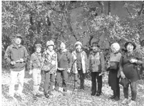
紅葉の桑名・諸戸氏庭園で

公園に隣接する六華苑は山林王と呼ばれた二代目諸戸清六の居住空間だったところ。贅の限りを尽くしたこだわりの建物には明治の元勳、大隈重信などもしばしば