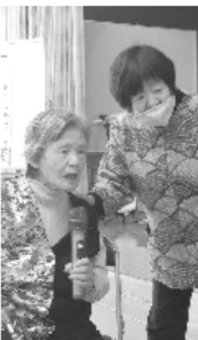
カラオケを楽しむ

①ウクライナ戦争や北朝鮮の核兵器・ミサイル実験に直面して、戦前とは異なる内容と形態で国防意識と愛国心が再編成されてきている。それに対しては、国際情勢と現代社会に関する科学的認識が重要である。 ②政府による原発政策の大転換が行われた。より安全な原発研究が進められているが、どれも高価で実現が不可能である。現在の軽水炉には大きな弱点がありとても危険である。原発は廃止しか