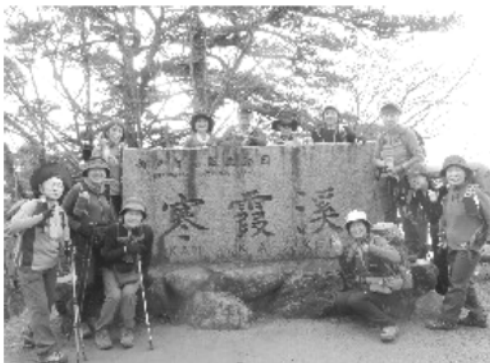
山歩会忘年登山「小豆島寒霞溪」

今回の旅は、芸濃町観光ガイド会から、無料の観光ガイドの派遣があり、5名の方が長徳寺で出迎えてくださいました。津市には観光を申し込んだら、その地域の支所・老人会などが組織的に動くように出来ているようです。そのため、今回の旅は芸濃町からの助けがあり、行程も全部立てて頂き、メールでのやりとりで、晴天時・雨天時などの計画も全部していただき