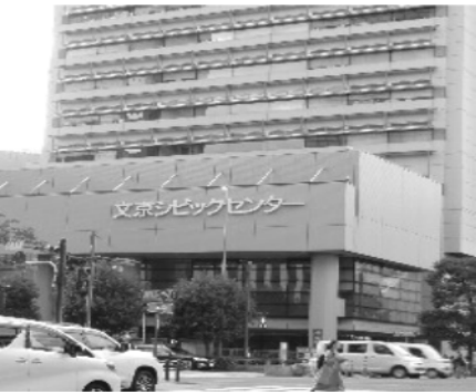
2日目会場の文京シビックセンター

一日目は分科会、①「戦争する国づくりと教育」、②「原発とエネルギー問題」の学習講座に参加しました