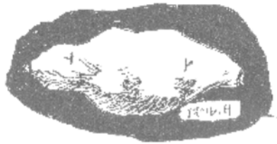
イラスト 樋口 出