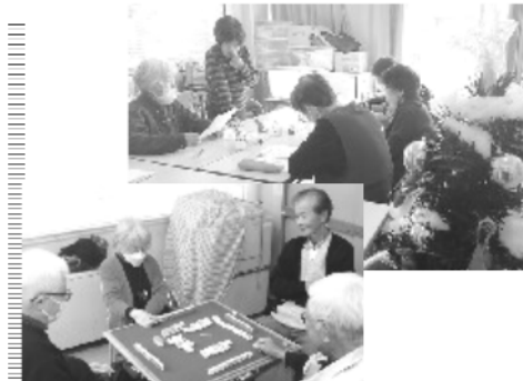
おしゃべりカフェ・麻雀

気なく話している方言が活字になって声に出して読むとなると、なかなか難しく、アクセントに戸惑い、面白く楽しく読めました。