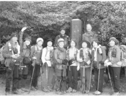
伊勢 朝熊山山頂にて

石のゴロゴロの道、又整備された木製階段もある道を約30分行くと体も温まり衣服調整の休憩。寒さ対策で着ぶくれの服を脱ぎ身軽になって歩く。丁石が次々に現れて十丁あたりに昔のケープルカー廃線跡を見て十二丁で再び休憩。時折見かけるお地藏様の前掛けもお正月らしく新しく赤色が鮮やかで目を引きまます。11時25分展望広場からの景色に見とれる。さらに登って11時50分頂上着(二十二丁)。写真に収まり「八大龍王神社」に手を合わせて参拝。頂上から富士山が見える時もあるとか、今日は雲があり残念。神社横で昼食。12時40分下山開始。少し下った所で一人が体調