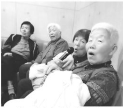
カラオケを楽しむ皆さん

昼は上品な味のお品書き付の会席料理でした。ビールで乾杯！最高ですね。その後は別室でカラオケと、ロビー