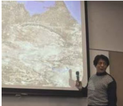
中国人が見る地図(上)