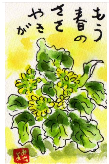
絵手紙 提供 長岡 美千代

重慶GG協会創立20周年記念大会で2GG合計トップの25で優勝出来ました。(約600名参加)又、今回は久々の優勝でうれしいです。」