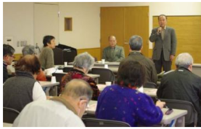
集会全員する会よくバスコミ

「鈴鹿市民のコミバスをよくする会」は、2月15日(金)にジェフリー鈴鹿で「全員集会」を行い、30数名の方に参加した。