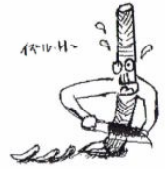
カット 樋口 出

作り方 ①牛肉は一口大に切り、ごぼうはさがきにして、アクを取り、れんこんもアクを取る。れんこん・人参はいちょう切りにして、オリーブオイルで炒め、少ししんなりしたら②を入れ、中~弱火で煮詰めて、汁がほとんどなくなったら切る。御飯は、炊き上がったたら、具を混ぜて出来上がり。