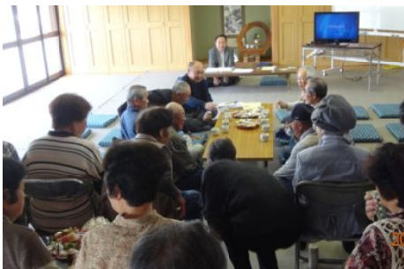
初回の地域懇談会のコミバス

参加された方からは、「歳をとつて車に乗れなくなつたらどこにも行けない」「家の近くまで来てくれる小型のオンデマンドバスを早く実現してほしい」などの声が語られ、全員がアンケートに記入、6名の方が新加入しました。