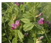
カラスノエンドウ (マメ科)