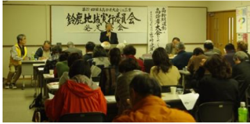
鈴鹿地域実委発足集会

第27 回日本高齢者大会の成功のためには、県下各地の地域実行委員会の活動が不可欠です。