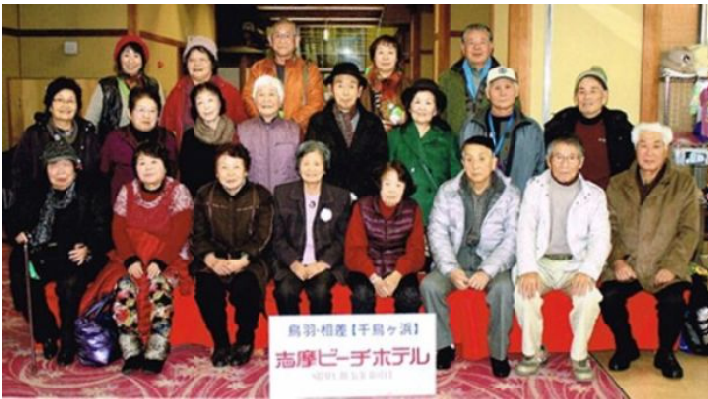
カラオケの会 新年会記念写真

久しぶりの一泊旅行で、心身とも癒され、すっきりした気持ちでソファーにもたれていきます。企画運営委員のみなさん(東口さん・佐藤さん・熊給さん)の緻密な計画と、テキパキした運営で、楽しく生き生きと過ごせた二日間になったことを感謝しております。有難うございました。