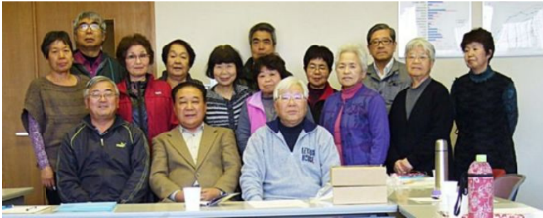
明けましておめでとうございます。今年もよろしく。執行委員一同