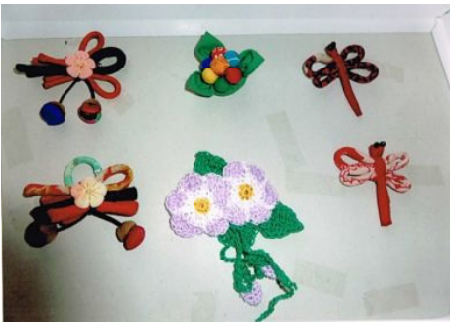
手芸教室の皆さんの作品