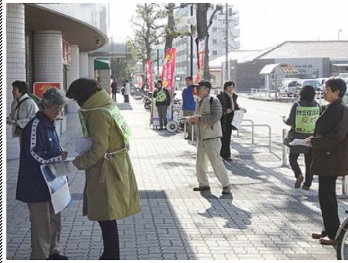
市民の会宣伝行動

て、全国で、違憲の、秘密保護法を廃止させる統一行動が、展開されました。 鈴鹿では、「反対する鈴鹿市民の会」の16名が、ハンター前で、チラシを配り、署名を集め、マイクで訴えました。チラシの受け取りも署名も協力的でした。 同じ署名は、「の」きらいに同封してありますので、「ご協力下さい。」