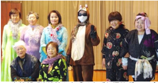
女性部「炭坑節」を盛り上げた仮装グループ