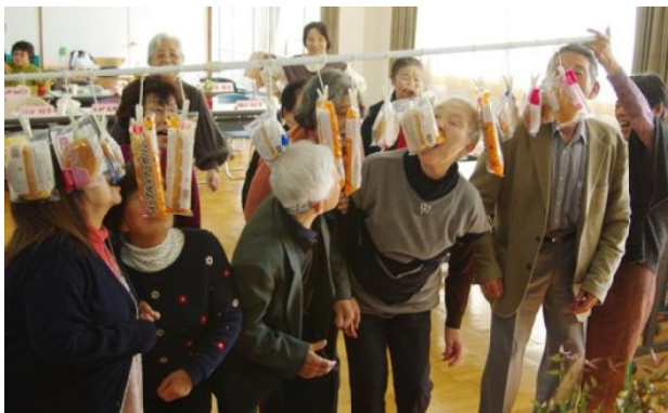
パン食い競走

食後は各自自己紹介と近況報告をしました。「サークルにはなかなか参加できないがお誕生会には参加するように