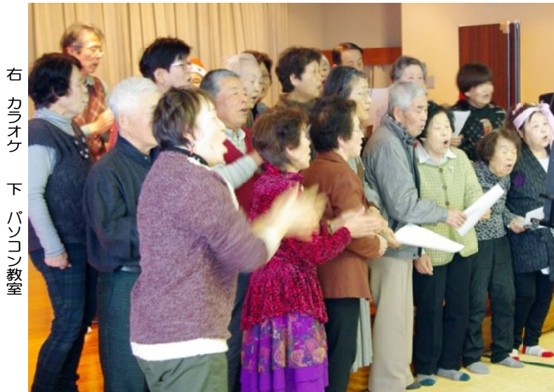
右カラオケ 下パソコン教室

サークルの芸を披露、特に「卓球」の「権兵衛さんの赤ちゃん」は、みんなで手と口を動かし、脳の活性化にも役立ちました。女性部のサークルは、みんなで「炭坑節」を着ぐるみを着る人、ドレスを着る人、そしてその他の人達は、風呂敷を被り、本当は志摩の方では中学くらいになると白い布を頭から被るそうです。その代用に風呂敷となり