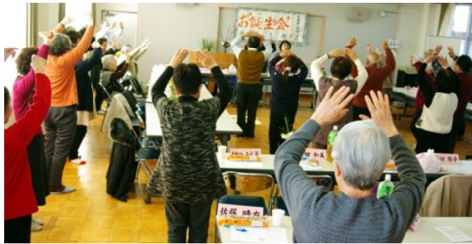
きよしのズンドコ節

している。」とか、「友達に誘われて初めて参加した。」など輪が広がっていました。そのあとは、アトラクション。パン喰い競争、みんなで「手のひらを太陽に」の手遊び、輪になって「きよしのズンドコ節」を踊るなど、楽しい時間が過ぎていきました。いつもお世話をいただき、女性部のみなさまをはじめ役員の皆様、本当にありがとうございました。